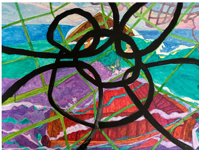
如网人生 丙烯布面 80x60cm 2025